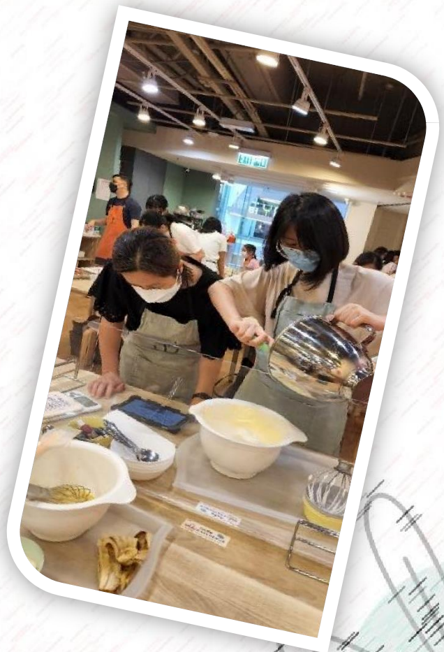
家長與同學齊心製作蛋糕