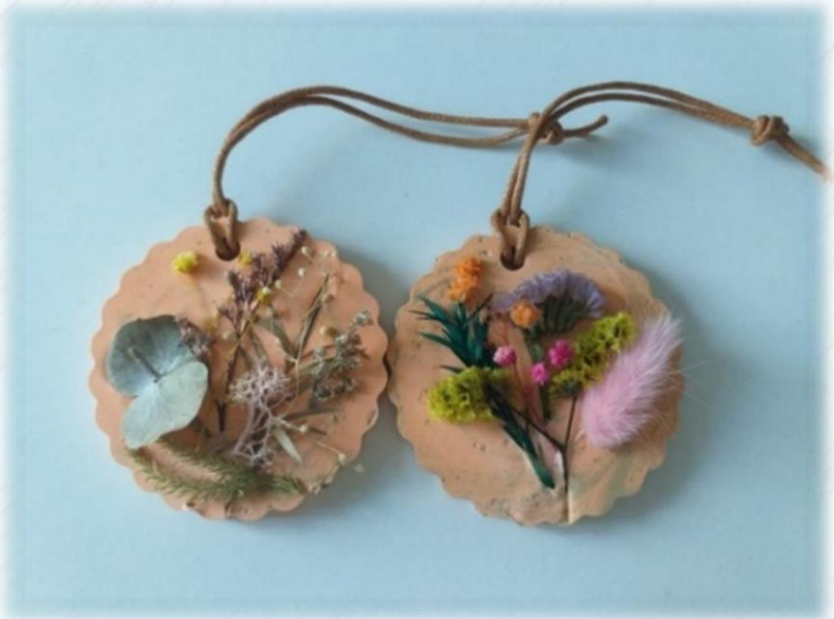
親子手工藝工作坊作品