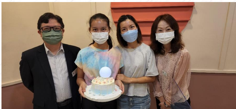
副校長、家教會主席與家長、同學合照

大家好，今次很感恩能參與學校舉辦親子蛋糕班，促進我和女兒之間的默契和互動。過程十分開心，又可以和其它家長彼此認識交流一下，見到蛋糕製成品亦很滿足。多謝家教會很用心安排是次活動。希望下次可以再次參與，樂在其中。