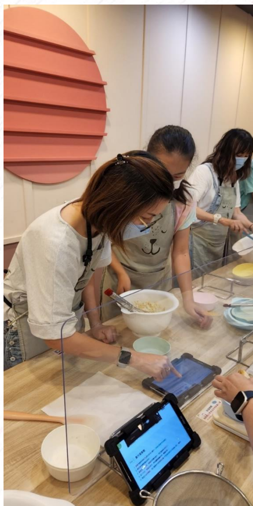
家長與同學一起製作美味蛋糕