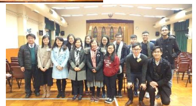
香港大學升學講座