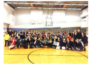
女子乙組籃球比賽冠軍