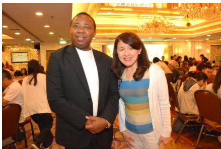
校長出席聖母無玷聖心主保瞻禮慶祝晚宴