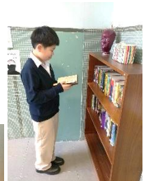
英文圖書放於校園四周