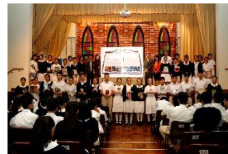
「漂洋圖書、細味深恩」