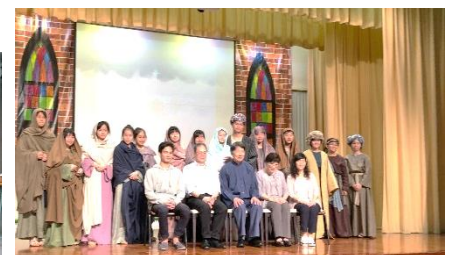
福傳音樂劇「耶穌傳」

各位家長，讓我們攜手栽培孩子成為品學兼優的明日領袖，使他們以積極態度認識真理，熱愛生命，關愛家人，在生活中實踐公義，日後成為一個「從心出發，知行合一」的領袖學生。