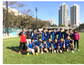
男子乙組足球比賽冠軍