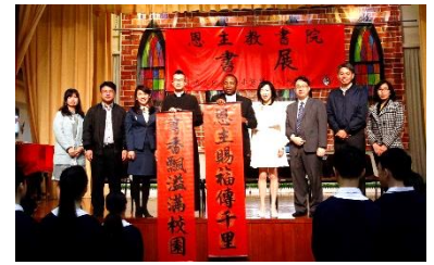
恩主教書展開幕禮